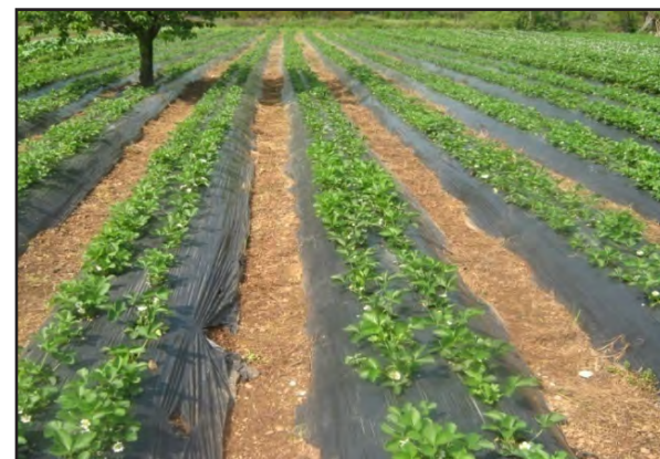
Zaštita zasada od korova

Treba preduzeti sve neophodne korake kako bi se izbjegla oštećenja ovih staništa.