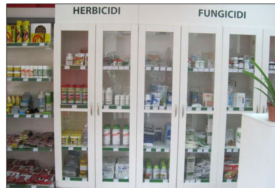
Pravilno čuvanje pesticida

Pesticide uvijek treba držati u njihovom originalnom pakovanju, a nikada u drugoj ambalaži, kao što su stare flaše, budući da je to uzrok mnogih fatalnih slučajeva trovanja.