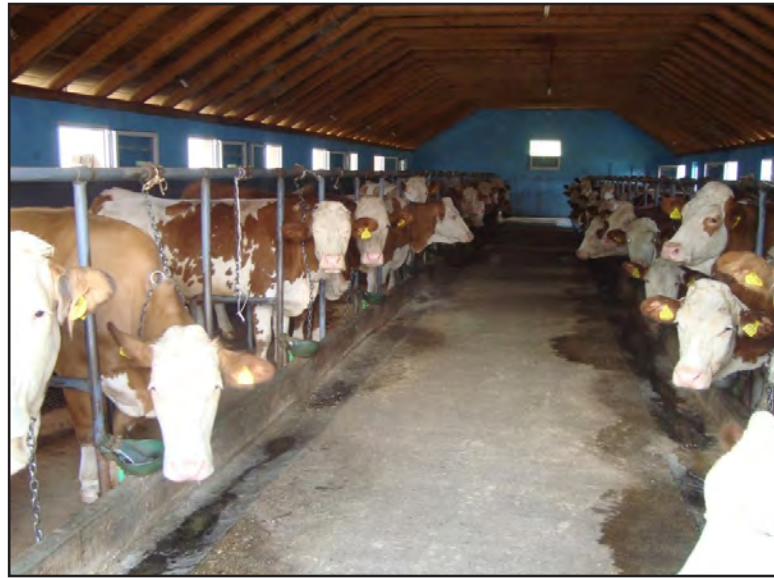
Vezani sistem držanja goveda