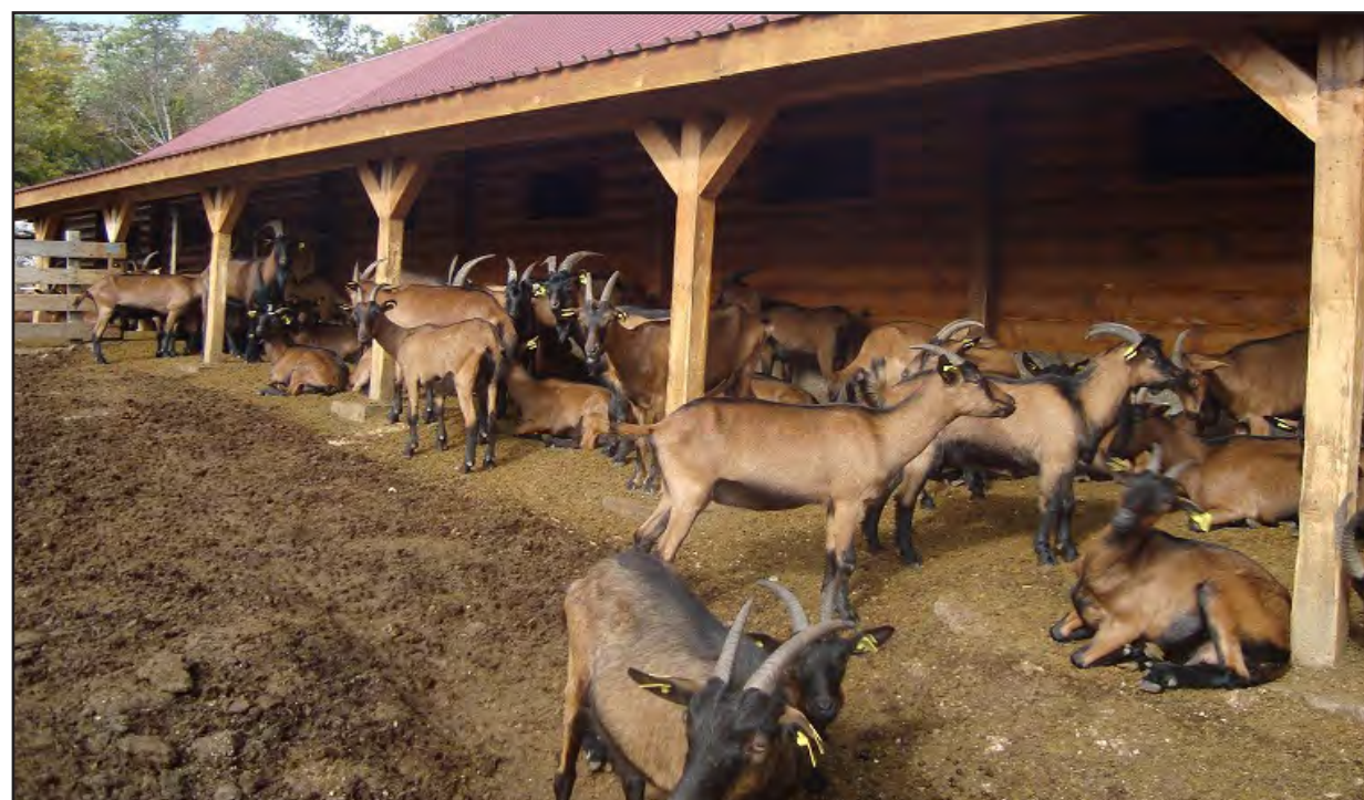
Advekatan smještaj za koze