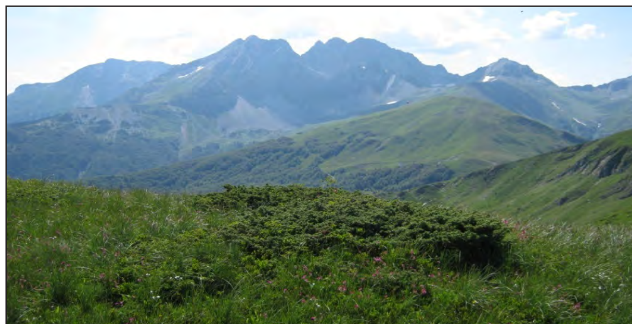
Šipražje u pašnjaku

Prirodne travnate površine treba održavati na način da se na njima vrši uzgoj dovoljnog broja grla stoke, kako bi se spriječio rast šipražja. Kao opšte pravilo, potrebno je najmanje 0,15 uslovnih grla stoke po hektaru, kako bi se spriječio razvoj šipražja. Ukoliko je koncentracija životinja po jedinici površine manja od navedene (0,15 UG po ha), onda pašnjak treba kositi ili potkresivati jednom godišnje, kako bi se suzbio razvoj šipražja i održale produktivne trave.