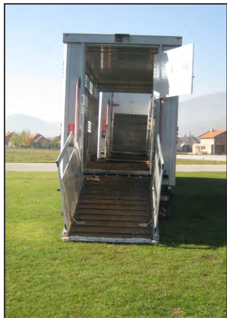
Rampa za utovar životinja

Za životinje je obično najstresniji dio puta ukrcavanje i iskrcavanje. Tu treba preduzeti posebne mjere, kao što su: