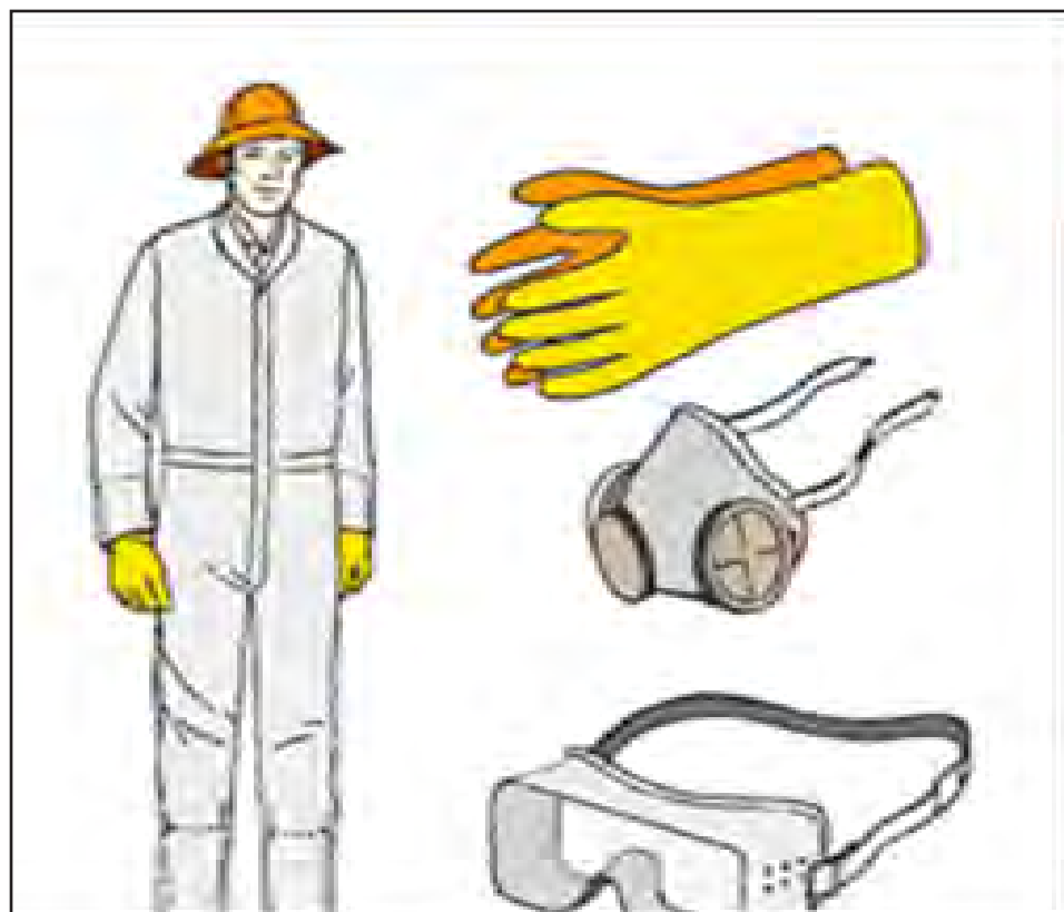
Neophodna zaštitna oprema

Lice koje rukuje pesticidima je najugroženije, budući da je izloženo djelovanju pesticida tokom cijelog procesa miješanja, prskanja i čišćenja nakon upotrebe. Mnogi pesticidi mogu da dospiju u ogranizam na više načina: kroz organe za disanje i preko kože, mogu da oštete kožu ili da proizrokuju trovanje. Bilo koji pesticid koji dođe u kontakt sa očima rukovaoca pesticida može da izazove oštećenja i veliki bol.