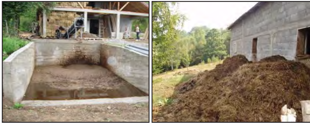
Dobar i loš primjer odlaganja stajnjaka