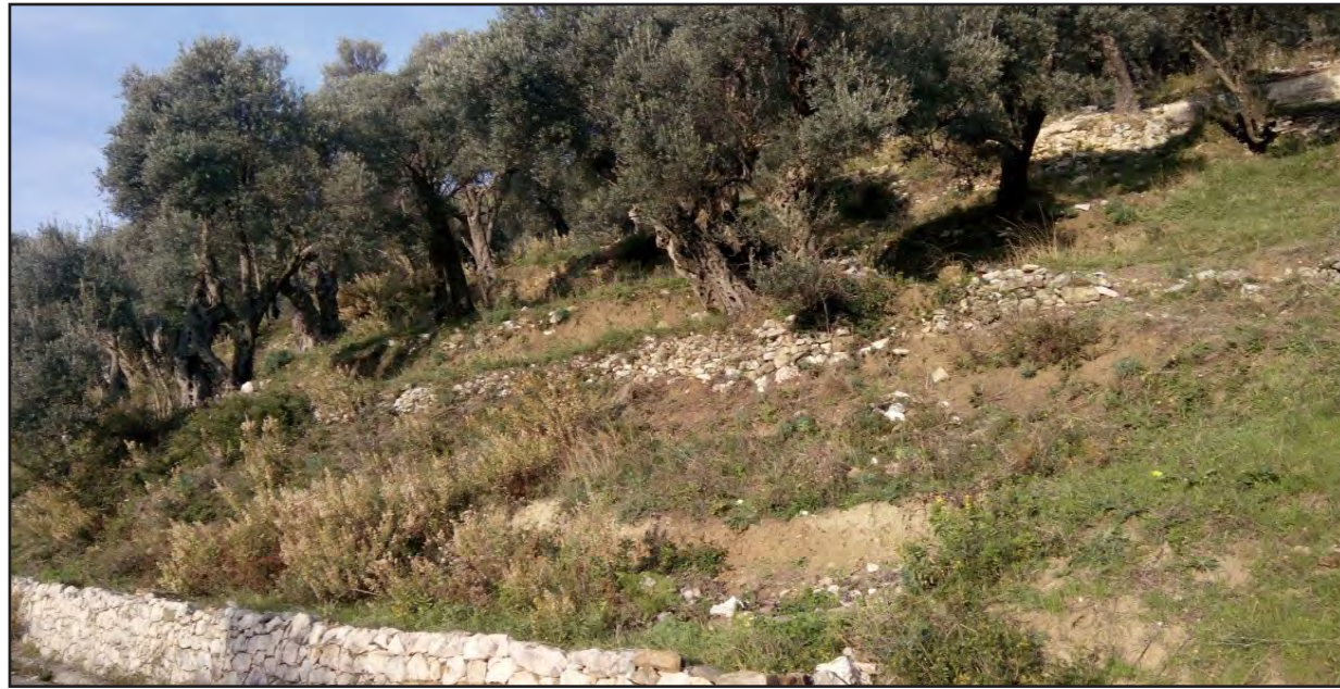
Primjer maslinjaka na nagibu gdje je potrebna zaštita od erozije, Valdanos, Ulcinj.

Ukoliko se zasad podiže duž padine, iz određenih razloga, onda između redova treba ostaviti travu da raste, kako bi se spriječila erozija. Kod ovakvih zasada, kada uništavanje korova postane neophodno, treba koristiti herbicide, a izbjegavati obradu zemljišta, kako bi korijenje trave ostalo u zemljištu, vezalo zemljište i spriječilo eroziju.