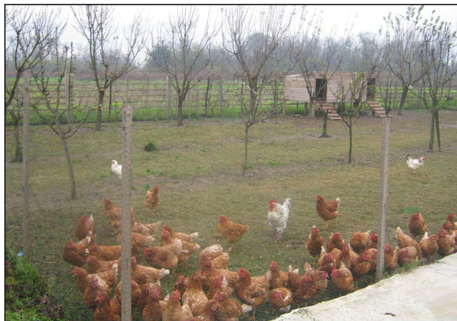
Slobodan sistem držanja kokošaka

Pod mora da bude od odgovarajućeg materijala koji ne ometa aktivnosti i fiziološke potrebe koka nosilja.