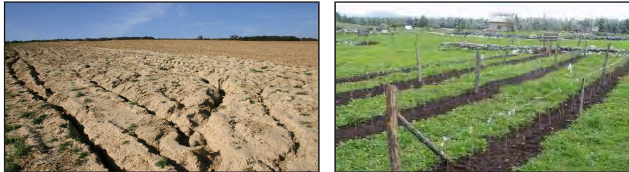
Primjeri dobro i loše održavanog zemljišta