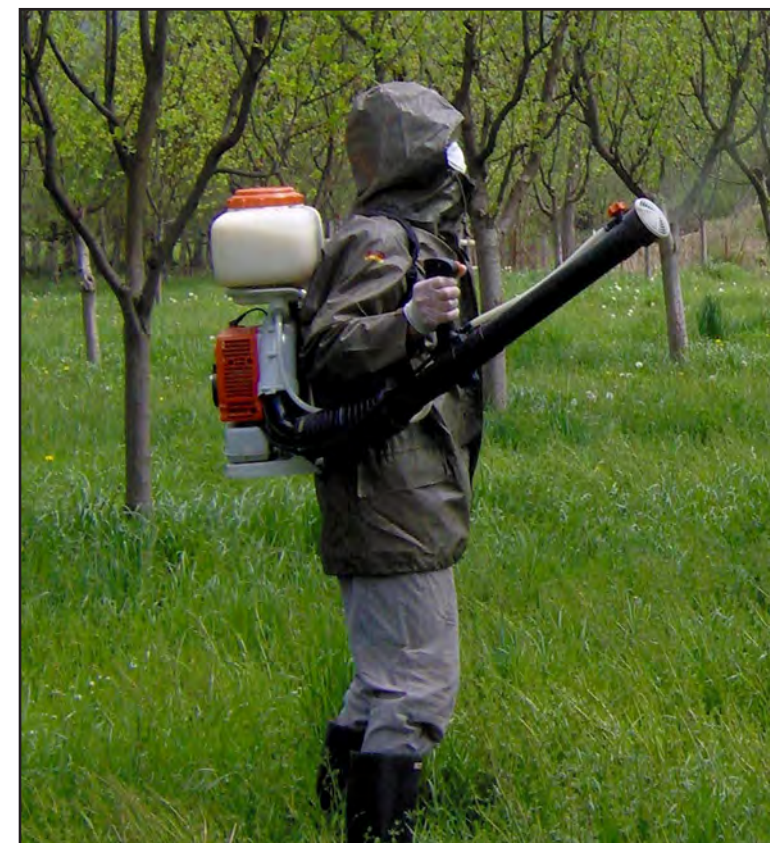
Primjena pesticida u voćnaku

Posebnu zaštitnu odjeću koja se koristi prilikom rukovanja pesticidima (npr. rukavice, zaštitno odijelo i maska protiv prašine ili respirator) treba koristiti samo u tu svrhu, i držati je na zaključanom mjestu van domašaja djece, životinja i daleko od hrane za životinje ili ljude, tj. u ili blizu magacina za pesticide.