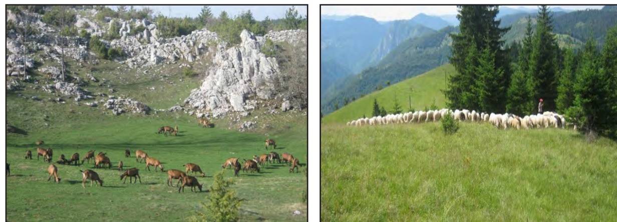
Koze i ovce na paši

Naročito bitan uslov za ovce i koze koje se drže u planinskim oblastima je da im se obezbijedi zaštita od loših vremenskih uslova i predatora kao što su vukovi, kao i da im se obezbijedi neophodna zdravstvena zaštita.