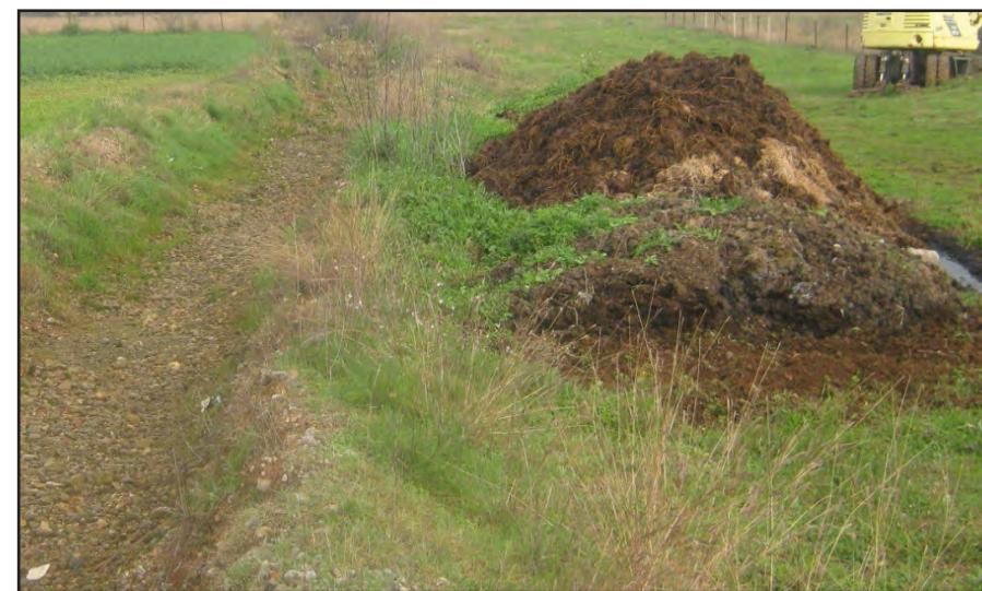
Nepravilno odlaganje čvrstog stajnjaka

Objekte za stoku treba projektovati i locirati tako da se tečno đubrivo i voda koja otiče zaustavi i ne zagađuje površinske i podzemne vode. Savjeti o projektovanju i lokaciji objekata za stoku mogu se dobiti od Službe za selekciju stoke.