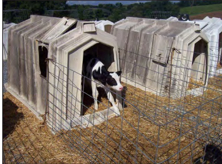
Prikladan prostor za držanje teladi

Gazdinstva sa pet ili manje teladi izuzeta su od nekih od ovih posebnih uslova u pogledu veličine boksova.